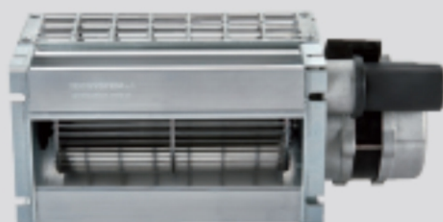
TG180 (COD. 1VN0060)