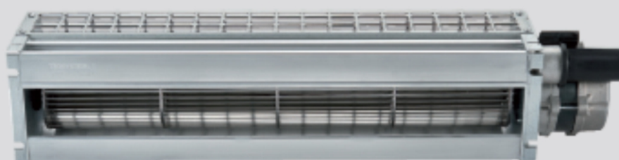
TG500 (COD. 1VN0062)